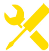
Onderhoud & reparatie